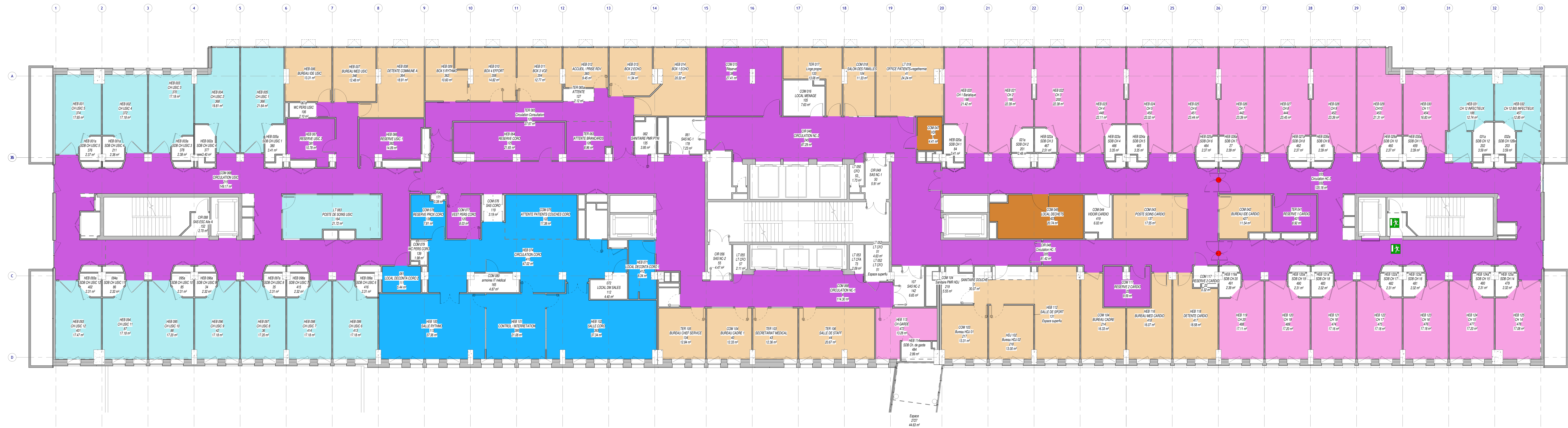
1 TRA_R+2 Ech : 1 : 100